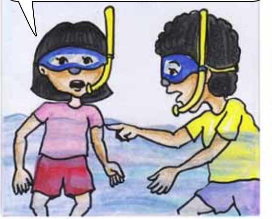
ពួកគេក៏ហែលសំដៅទៅកាន់ទុកនេសាទនោះ

មើលចុះ! អ្នកនេសាទទាំងនោះកំពុងតែបំផ្លាញផ្កាផ្ទះអស់ ហើយ! អញ្ចឹងតើ បានជាអ្វីៗគ្រប់បែបយ៉ាងនៅទីនេះងាប់ គ្មានសល់! តុះ! យើងនាំគ្នាទៅនិយាយជាមួយពួកគាត់ មើលដើម្បីឲ្យដឹងច្បាស់ពីអ្វីដែលកំពុងកើតឡើង។