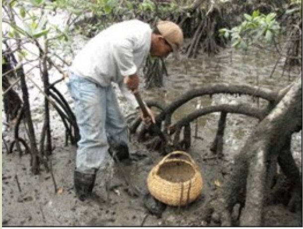
Mangrove oyster harvesting in Mandira Extrative Reserve, Sao Paulo State