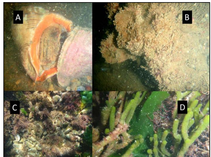
Fig. 2. In Gorriti Island, high densities of Rapana venosa (A) were found associated with rocks showing little or no mussel cover (B), in contrast to subtidal areas where the R. venosa is not present (C & D).

Carranza, A., Defeo, O. & Beck, M.W. 2008. Diversity, conservation status and threats for native oysters (Ostreidae) around the Atlantic and Caribbean coasts of South America. Aquatic Conservation: Marine and Freshwater Ecosystems 19: 344-353.