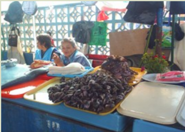
Choro in a local market