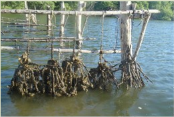
Suspended culture of mangrove oysters

On the Caribbean coast, mangrove oysters Crassostrea rhizophorae , have been important for fisheries production but have been affected by alterations in river flow. The population in the largest coastal lagoon Ciénaga Grande de Santa Marta (CGSM) had nearly vanished by 1996, although recent monitoring data suggests that a remnant population exists. Full recovery of this population is hindered by unauthorized harvest and although C. rhizophorae is included on Colombia's Red List of threatened species there are no near-term management plans for conservation. Ideally, future management plans should include restoration of oyster beds combined with development of aquaculture to reduce pressure on remaining wild stocks.