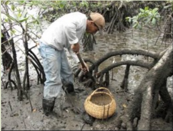
Mangrove oyster harvesting in Mandira Extrative Reserve, Sao Paulo State