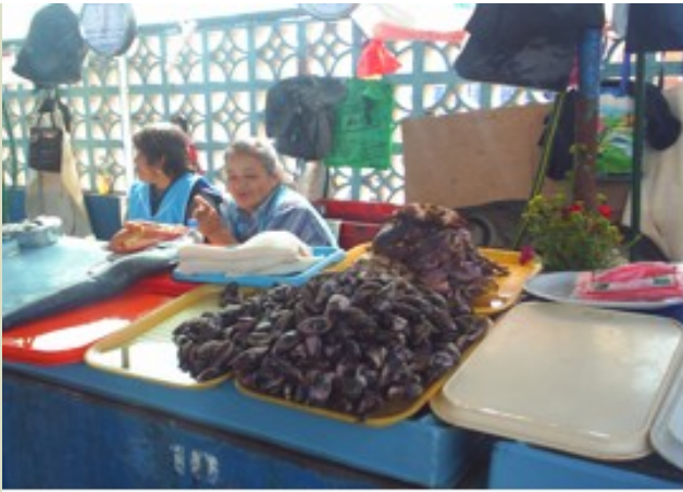
Choro in a local market