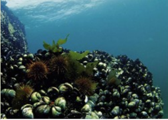
Beds of 'Choro' mussel Choromytilus chorus

C. chorus , but there are no reported results for these experiences. For Choromytilus chorus , it has been shown that the area must be large enough to ensure the presence of several patches with asynchronous recruitment and the presence of certain species of algae to promote successful recruitment.