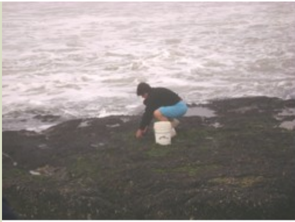
Harvesting brown mussels Perna perna in Punta del Diablo, Uruguay