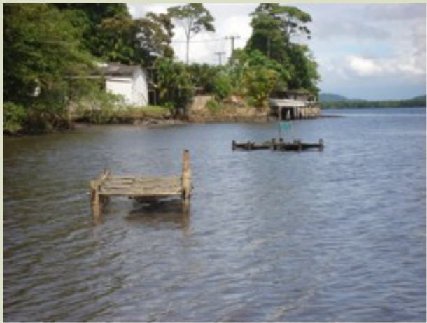
Aquaculture facilities in Bertioga Channel, Sao Paulo State