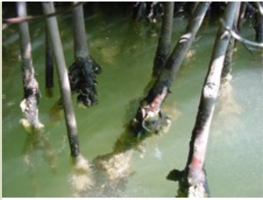
Mangrove oysters in Rhizophora mangle roots