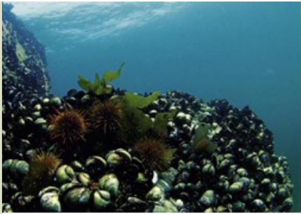
Beds of 'Choro' mussel Choromytilus chorus