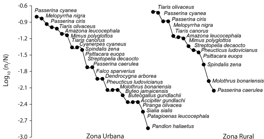
Fig. 3. Curvas de rango-abundancia de las 24 especies de aves registradas en cautiverio en localidades urbanas y rurales de la región central de Cuba durante el 2014 y 2015.