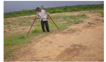
Triangle à niveau