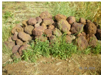
Moellons de pierres