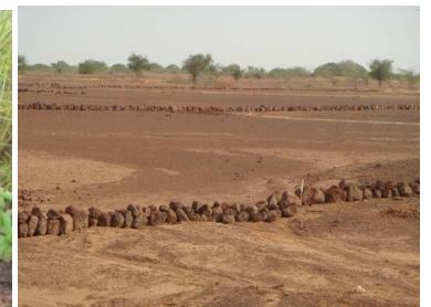
Association cordons pierreux Andropogon pseudapricus