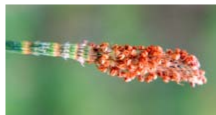
Casuarina glauca Casuarinaceae espiga masculina casuarina, pino de Australia