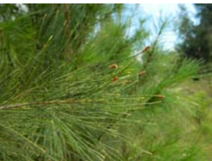
Casuarina glauca Casuarinaceae espigas masculinas casuarina, pino de Australia