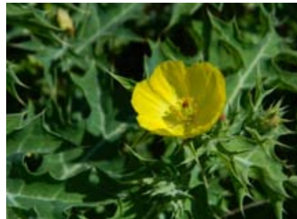
Argemone mexicana Papaveraceae cardo santo flor