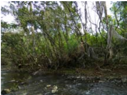
Syzygium jambos varios árboles a orillas del río pomarroza, manzana rosa