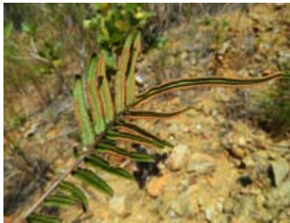
Pteris vittata helecho