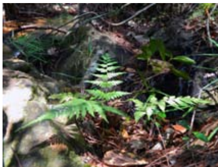
Macrothelypteris torresiana penquita, helecho arborescente