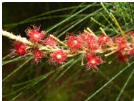
Casuarina glauca Casuarinaceae casuarina, pino de Australia