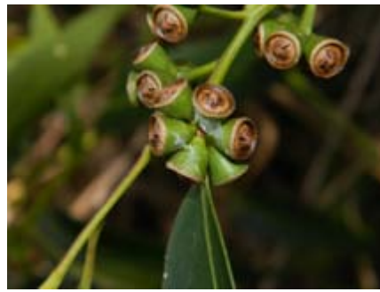
Eucalyptus sp. eucalipto