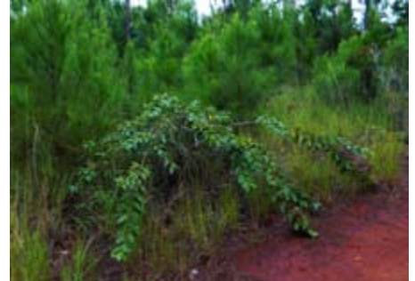
Psidium guajava guayaba

Orchidaceae flores y un fruto cardo santo