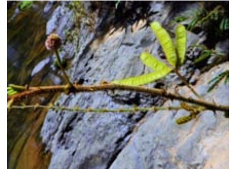
Mimosa pigra weyler, reina, aroma de agua