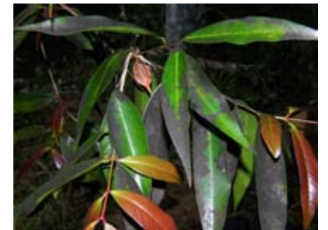
Syzygium jambos hojas afectadas por la roya pomarroza, manzana rosa