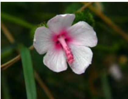
Urena lobata malva de Cuba, malva del país