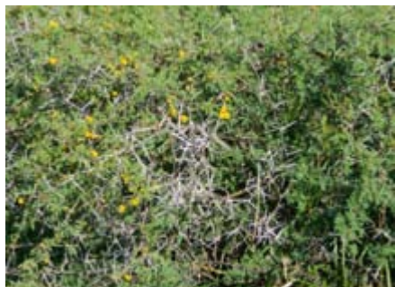
Acacia farnesiana Mimosaceae aroma, aroma amarilla