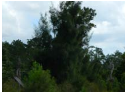
Casuarina glauca Casuarinaceae casuarina, pino de Australia