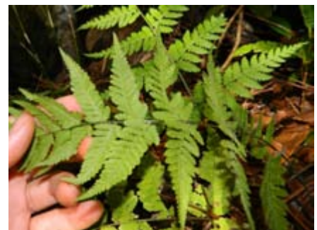
Macrothelypteris torresiana penquita, helecho arborescente