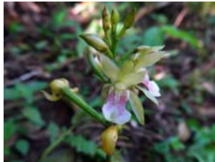
Oeceoclades maculata amarilla

Orchidaceae planta con frutos aroma, aroma