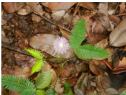
Mimosa pudica dormidera