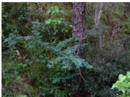
Dichrostachys cinerea Mimosaceae marabú