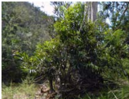
Syzygium jambos pomarroza, manzana rosa