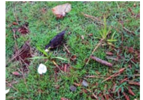
Zoysia matrella yerba Manila