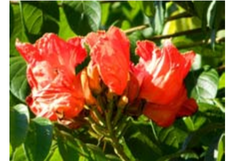
Spathodea campanulata tulipán africano