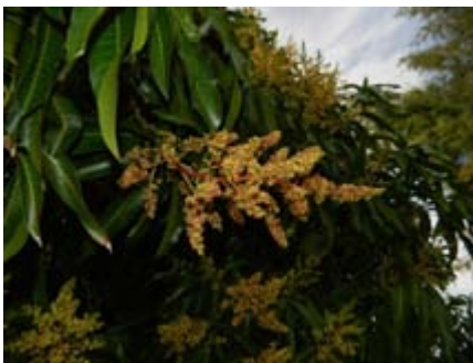
Mangifera indica mango