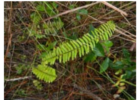
Nephrolepis hirsutula helecho, penquita, puntero