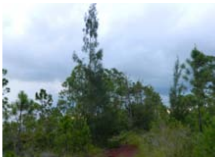
Casuarina glauca Casuarinaceae casuarina, pino de Australia