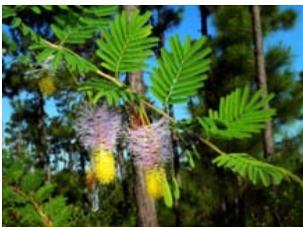
Dichrostachys cinerea Mimosaceae marabú