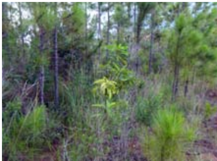
Mangifera indica postura creciendo en un pinar mango