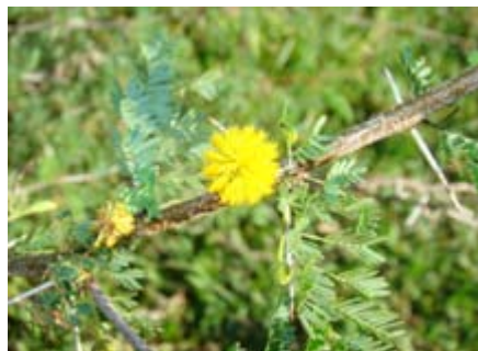
Acacia farnesiana Mimosaceae aroma, aroma amarilla