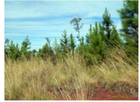
Hyparrhenia rufa hierba Jaragua