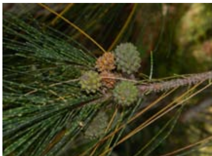
Casuarina glauca Casuarinaceae cono femenino casuarina, pino de Australia