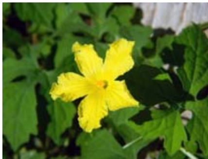
Momordica charantia cundeamor