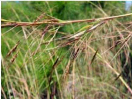
Hyparrhenia rufa hierba Jaragua