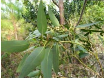
Eucalyptus sp. eucalipto