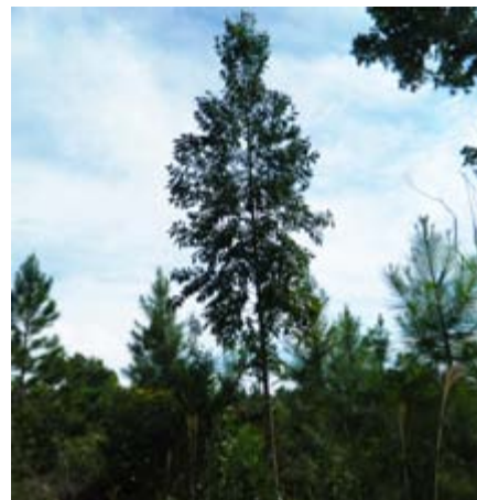
Eucalyptus sp. Myrtaceae eucalipto