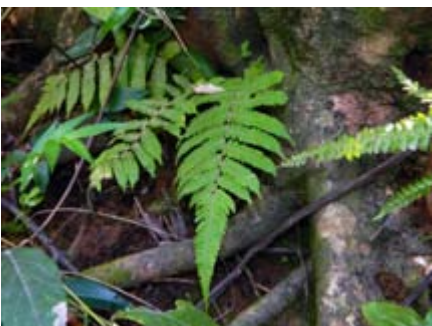
Thelypteris dentata helecho