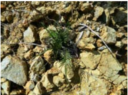
Pteris vittata helecho