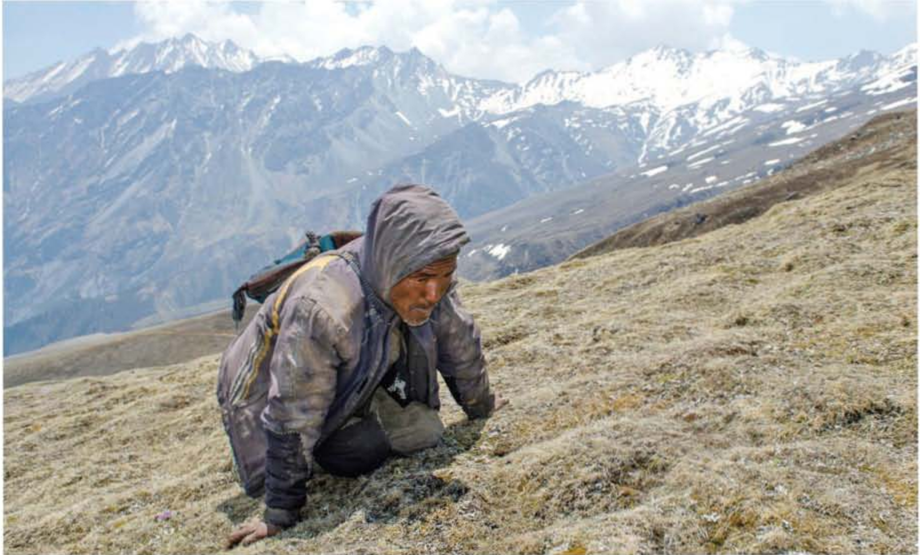
डोल्यामा यासां खोजिरहेका एक वृद्ध

परिवर्तनको कारण पहिले नै उच्च जोखिममा परेका हिमाली भेगका वनस्पति र परिस्थिकीय प्रणालीमा नकारात्मक असर परिरहेको सजिलै अनुमान गर्न सकिन्छ। र, यसको मूल्य दीर्घकालीन रूपमा चर्को हुन सक्छ।