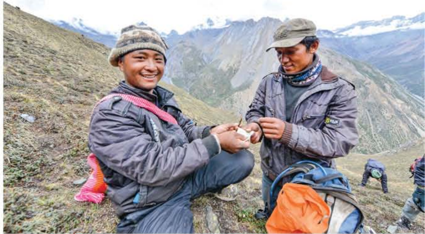
मनाङमा यासाको किनबेच

त्यसो त यासाको व्यापार गोप्य साँठगाँठमा हुने भएकाले स्थानीय संकलकले वास्तविक बजार मूल्यभन्दा निकै कम हिस्सा प्राप्त गरिरहेका छन्। कतिपय अवस्थामा बाहिर जिल्लाबाट आएका संकलकलाई स्थानीयले सस्तोमा बेच्न बाध्य बनाएका उदाहरण पनि छन्। वास्तविक संकलकले लाभको कम हिस्सा प्राप्त गर्छन्, जसले गर्दा उनीहरूको आर्थिक अवस्थामा सुधार हुने वातावरण बन्न सकेको छैन।