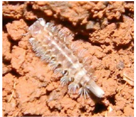
Fig. 11. Milpié del Orden Polyxenida.