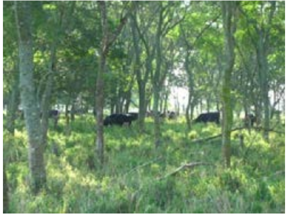
Fig. 40. Sistema Silvopastoril de Leucaena leucocephala .