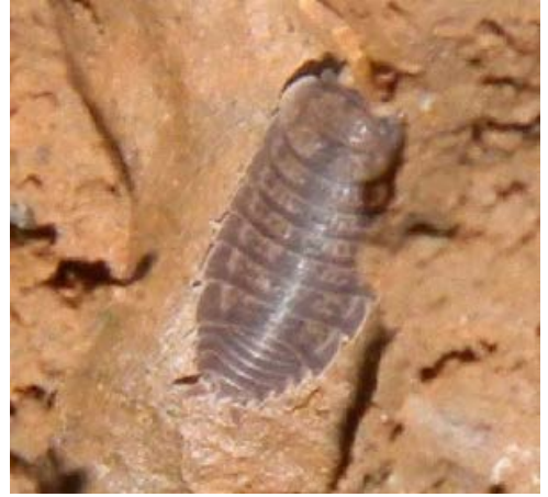
Fig. 7. Cochinilla de la Familia Trachelipidae Especie Nagarus sp.