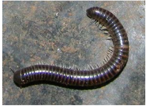
Fig. 9. Milpié de la Familia Trigoniulidae Especie Leptogoniulus sorornus .

Los diplópodos o milpiés son netamente detritívoros, tienen una función importante en la fragmentación y descomposición de la hojarasca, influyendo en la disminución del tamaño de los restos vegetales. Algunas especies están fuertemente asociadas a madera podrida porque habitan bajo la corteza de los árboles, mientras otros solo se encuentran en cuevas. Tienen, al igual que otros habitantes de la hojarasca y la superficie del suelo, una alta dependencia del contenido de humedad.