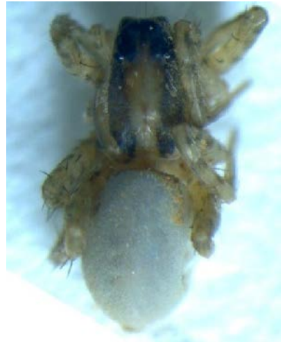
Fig. 13. Araña de la Familia Lycosidae.

Otros representantes de arácnidos que se pueden encontrar con facilidad en el suelo son los opiliones o arañas patonas (Fig. 14) y los pseudoescorpiones o falsos escorpiones. Los primeros, muy parecidos a las arañas y de cuerpo pequeño, se diferencian por tener las patas largas y delgadas y el cefalotórax y el abdomen fusionados. Los falsos escorpiones son muy pequeños y semejantes a los escorpiones, pero el abdomen es sin cola y sin glándula venenosa.