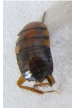
Fig. 15. Cucaracha de la Familia Blattidae Especie Periplaneta sp.

Las cucarachas consumen con mayor frecuencia todo tipo de material muerto, ya sea de origen animal o vegetal (omnívoros y detritívoros). Algunas pueden consumir material vegetal vivo (herbívoros). Son de actividad nocturna fundamentalmente y se encuentran en un amplio rango de ecosistemas, desde áreas silvestres hasta cultivadas como por ejemplo, los sistemas agrícolas urbanos.