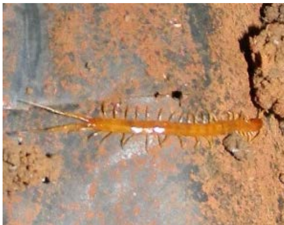
Fig. 12. Ciempié o Escolopendra Familia Scolopocryptopidae stollii. Especie Newportia

Conocidos popularmente como ciempiés y escolopendras. Cuerpo segmentado, alargado y plano, dividido en cabeza y tronco. Usualmente azulados, amarillos pálidos y naranjas o con otras combinaciones de colores. A diferencia de los milpiés, poseen un par de patas por segmento del cuerpo, y pueden llegar a medir desde unos mm hasta varios cm. Tienen un par de antenas, por lo general de considerable longitud, localizadas en el margen anterior de la cabeza. Al final del cuerpo presentan el telson, del cual se extienden un par de apéndices a modo de patas.