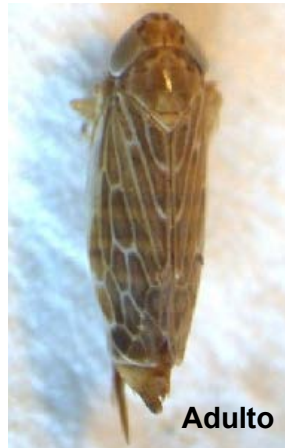
Fig. 26. Salta hoja de la Familia Cicadellidae.