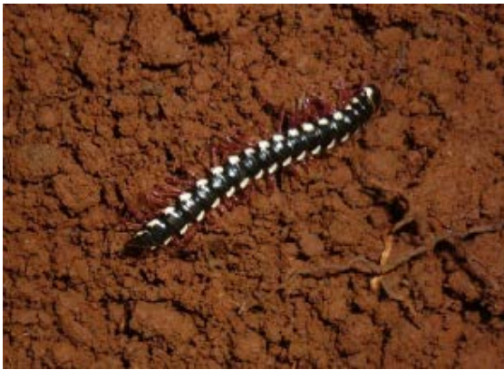
Fig. 10. Milpié del Orden Polydesmida.