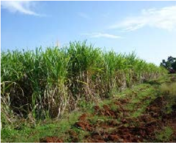
Fig. 36. Monocultivo de Saccharum officinarum (caña de azúcar).