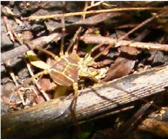
Fig. 14. Opilión de la Familia Cosmetidae.

Todos son depredadores y las principales presas son los insectos, tales como las larvas de moscas, escarabajos adultos y en estado larval, polillas pequeñas, así como cochinillas y termitas. Habitan la hojarasca y las grietas de la superficie del suelo, bajo piedras, cortezas de troncos; y pueden vivir en los nidos de termitas y hormigas, sobre todo los falsos escorpiones. Las arañas producen seda, llamada telaraña y algunas la usan para cazar a sus presas, otras arañas son cazadoras activas. Las arañas pueden indicar la calidad del hábitat ya que requieren de recursos alimenticios y de refugio disponibles en el ecosistema.