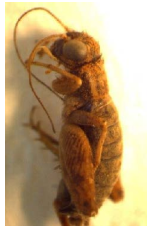
Fig. 35. Grillo no identificado.

Son herbívoros, comunes en áreas con vegetación rastrera, de gramíneas y leguminosas forrajeras. Tanto las ninfas como los adultos son eficientes cavadores, que abren galerías en el suelo donde permanecen durante el día. En la noche salen a la superficie en busca del alimento.