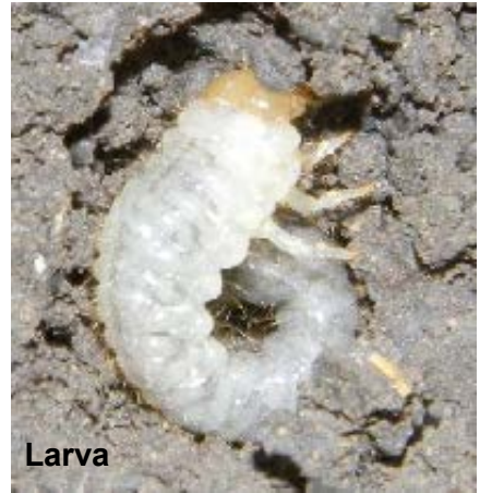
Fig. 20. Escarabajo de la Familia Scarabaeidae.

Estas familias tienen caracteres externos bien definidos que posibilitan su diferenciación. Los adultos de Carabidae tienen colores oscuros, lustrosos, metálicos e iridiscentes, y algunos presentan un estrechamiento en el tórax, que separa esta región del resto del cuerpo. También Tenebrionidae posee colores oscuros pero opacos, con respecto a los carábidos, y un tegumento duro y grueso. Chrysomelidae tiene la superficie de los élitros de color brillante y siempre con líneas o manchas; mientras Staphylinidae tiene la mayoría de sus individuos con cuerpo alargado y con élitros de un solo color y acortados que no cubren totalmente el abdomen. La característica más destacada de Curculionidae es que su cabeza se prolonga en forma de pico, en el extremo del cual se abre la boca. Entre las larvas de Scarabaeidae y Elateridae, las primeras son gruesas, de cuerpo blando y jorobadas en forma de U, mientras que las segundas son finas, alargadas y de constitución dura, por lo cual son llamadas gusanos alambre.