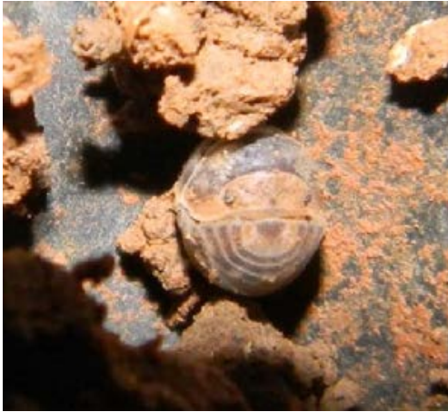
Fig. 6. Cochinilla de la Familia Armadillidae Especie Venezillo sp.

Los isópodos o cochinillas se alimentan de material vegetal muerto, por lo que ayudan en la descomposición de la hojarasca, y en algunas situaciones pueden ingerir excrementos, restos animales y material vegetal vivo. La mayoría son altamente susceptibles a la pérdida de agua, debido a lo cual están restringidos a hábitats húmedos. Por su permanencia en la superficie del suelo, pueden ser afectados por el intenso laboreo y la adición de plaguicidas, fundamentalmente.