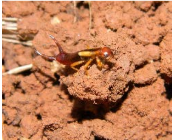
Fig. 23. Tijereta de la Familia Forficulidae.