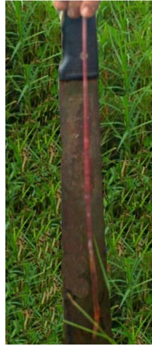
Fig. 1. Lombriz de tierra de la Familia Megascolecidae Especie Polypheretima elongata , común en pastizales.

Desde el punto de vista funcional, son considerados ingenieros del ecosistema ya que su acción fundamental es la transformación de las propiedades físicas del suelo (regulan la compactación, la porosidad, las condiciones hídricas y la macroagregación). Existen, además, diferentes tipos o categorías ecológicas de lombrices, según dónde viven y se alimentan: epígeas, anécicas y endógeas. Las lombrices epígeas viven y se alimentan en la superficie del suelo, entre la hojarasca, son pequeñas, pigmentadas (con color rosado, rosado azuladas, con bandas amarillentas o naranjas) y tienen movimientos rápidos. Las anécicas y endógeas viven y se alimentan en el interior del suelo, aunque las anécicas migran a la superficie en busca de su alimento, son de medianas a grandes, parcialmente pigmentadas o no pigmentadas (blancas) y de movimientos lentos. La mayoría de las especies de lombrices presentes en Cuba son anécicas o endógeas, con función detritívora, pues consumen materia orgánica con alto grado de descomposición junto a material mineral del suelo. Pueden ser buenas indicadores ante situaciones como la contaminación por plaguicidas y metales pesados*, compactación, contenido de materia orgánica y condiciones hídricas en el medio edáfico.