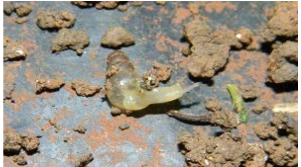
Fig. 5. Caracol de la Familia Subulinidae Especie Subulina octona .