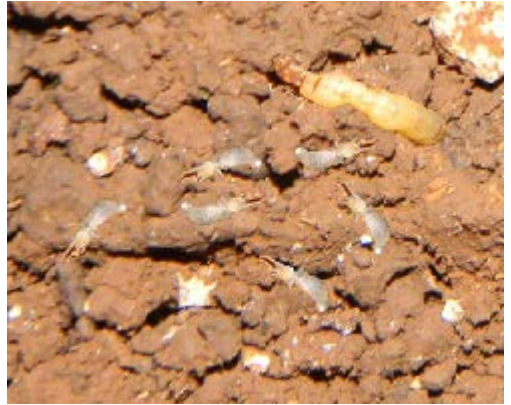
Fig. 31. Termitas de la Familia Termitidae Especie Anoplotermes schwarzi Reina y Obreros, ausencia de Soldados.

Las termitas, como las hormigas, son insectos sociales, formadores de colonias donde conviven las diferentes castas. El par real (reina y rey) se encarga de la reproducción durante toda la vida de la colonia; las obreras y los soldados cumplen con la formación, cuidado del nido y la protección contra los depredadores, respectivamente. Son de cuerpos blandos, blanquecinos o incoloros, con boca masticadora. A diferencia de las hormigas tienen antenas rectas, uniformes, no acodadas; además, no presentan la estructura de pedicelo entre el torác y el abdomen. Los adultos o alados, quienes asumirán el rol del par real dentro de la colonia, presentan alas membranosas, ambas activas en el vuelo. Abdomen con alrededor de 10 segmentos.