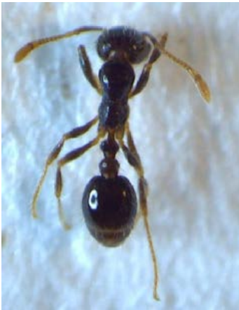
Fig. 27. Hormiga brava Familia Myrmecinae Especie Solenopsis geminata.