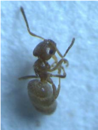
Fig. 28. Hormiga de la Familia Formicinae Especie Nylanderia fulva.