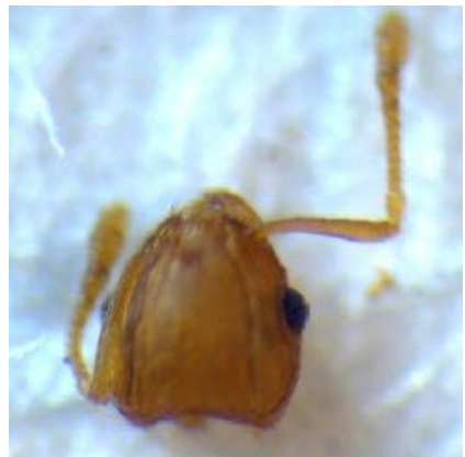
Fig. 29. Cabeza de la Hormiga santanilla Familia Myrmecinae Especie Wasmannia auropunctata.