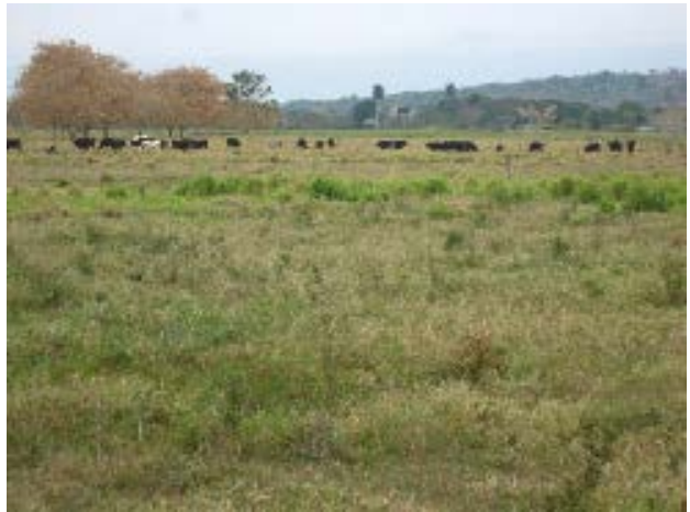
Fig. 37. Pastizal sin árboles