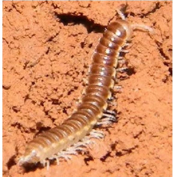
Fig. 8. Milpié de la Familia Paradoxosomatidae Especie Chondromorpha xanthotrica .

Artrópodos* cilíndricos, segmentados, de múltiples patas, diferente coloración (negros, carmelitas y grises generalmente) y tamaño (desde 2 mm hasta varios cm de longitud). Cuerpo compuesto por la cabeza y el tronco, el cual es alargado, de constitución dura, que termina en el telson donde abre el ano. Cabeza con un par de ojos, provista de mandíbulas y antenas cortas. Cada segmento del tronco con dos pares de patas, característica que le da nombre al grupo (Diplopoda). Algunos milpiés pequeños tienen espinas en cada segmento que sobresalen lateralmente, y no son de constitución dura, como los pertenecientes al orden Polyxenida. La mayoría de las especies portan un par de glándulas por segmento que secretan una sustancia repelente cuando se sienten amenazados. También, para defenderse de los depredadores, se enroscan y adoptan forma esférica.