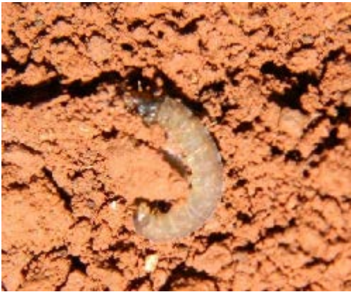
Fig. 33. Oruga de la Familia Tineidae Especie Acrolophus sp.

En el suelo se pueden encontrar en estado adulto a las polillas, que al contrario de las mariposas no tienen colores vistosos y su actividad es fundamentalmente nocturna. También es muy común encontrar orugas, que constituyen la fase larval de los lepidópteros. Las mariposas y polillas son distintivas por la presencia de escamas en todo el cuerpo, y por tener boca en forma de trompa enrollada que permite chupar el néctar de las flores. Las orugas, por su parte, tienen forma de gusano, a veces envueltas en una seda, con la cabeza y los tres pares de patas diferenciados, y con unas estructuras proyectadas o abultadas hacia el final del cuerpo, consideradas falsas patas. Las orugas son fáciles de encontrar en profundas cámaras o galerías, en pastizales y otros sistemas; además, tienen hábitos herbívoros pues se alimentan de las hojas de las plantas.