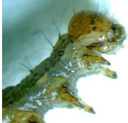
Fig. 34. Oruga de la Familia Erebididae Especie Mocis sp.