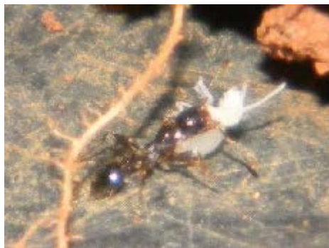
Fig. 30. Hormiga brava cargando una termita.

Sus nidos pueden ser simples o altamente complejos, formados en la superficie o en el interior del suelo, para lo cual remueven los diferentes estratos de este medio, contribuyendo así a la dinámica de descomposición y mineralización* de la materia orgánica. De esta manera, también crean sitios de refugio y alimentación para otros organismos descomponedores. Al igual que las lombrices de tierra, su acción fundamental es como ingenieros del suelo en la modificación de su estructura física. Las hormigas son organismos omnívoros, poco selectivos, que consumen todo tipo de material vegetal o animal. También pueden ser efectivos depredadores de otros invertebrados, controlando sobre todo la población de herbívoros y la producción vegetal. Algunos especialistas han registrado un aumento de su abundancia, diversidad y actividad en sistemas agrícolas integrados.