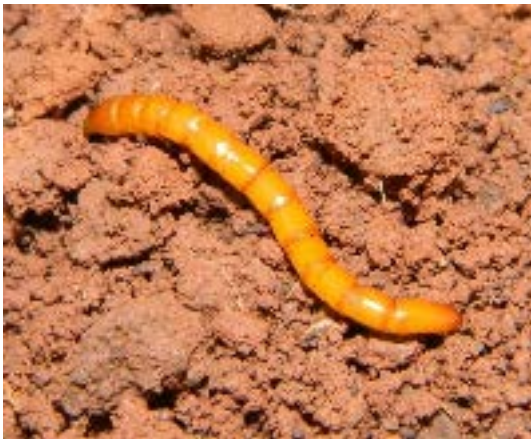
Fig. 21. Escarabajo de la Familia Elateridae.

Las familias Elateridae, Scarabaeidae, Curculionidae y Chrysomelidae son fundamentalmente herbívoras, ya sea de hojas, tallos o raíces. Las dos primeras familias viven en el interior del suelo, entre las raíces de las plantas, y el resto pueden ser encontradas entre la hojarasca superficial. Por su parte, Tenebrionidae es detritívora y Carabidae depredadora de otros escarabajos, de larvas de moscas y de mariposas, de chinches, de caracoles y de microartrópodos como los colémbolos*. En el caso de Staphylinidae tiene especies herbívoras, detritívoras y también depredadoras de otros insectos y de microartrópodos como los ácaros oribátidos*. Tenebrionidae, Carabidae y Staphylinidae pueden ser halladas en la superficie o en el interior del suelo. Algunas de estas familias son muy sensibles a cambios en las prácticas agrícolas que afectan los recursos disponibles, ya sea por la aplicación de fertilizantes, plaguicidas o laboreo intenso.