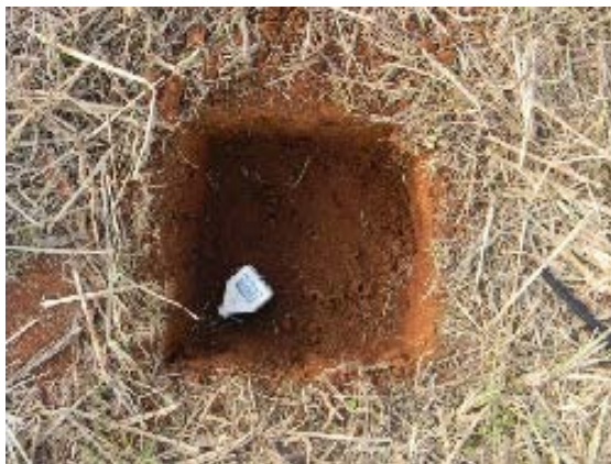
Fig. 41. Cuadrante de suelo de 25 x 25 x 20 cm.