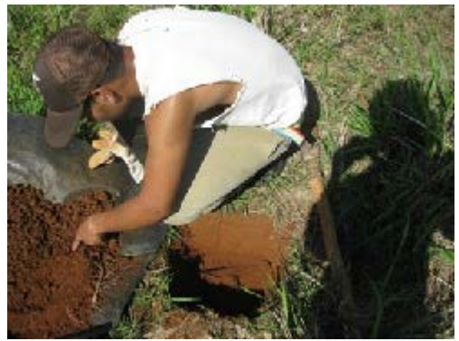
Fig. 43. Recolección de la macrofauna en el campo.

2. Separación y conteo de la macrofauna fuera del campo (en un laboratorio, en un aula u otro sitio). El análisis contemplará la suma de los cinco cuadrantes estudiados por sistema de cultivo.