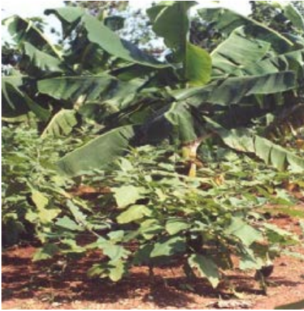
Fig. 39. Finca Agroecológica.