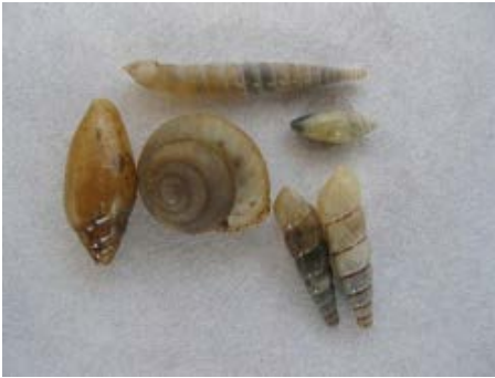
Fig. 4. Caracoles de diferentes especies que se encuentran en el suelo.

Las babosas y la mayoría de los caracoles viven entre la hojarasca y son detritívoros que se alimentan de materia orgánica no viva de origen animal y vegetal. No obstante, las babosas pueden consumir material vegetal vivo y dañar en ocasiones los cultivos. Algunos caracoles son carnívoros y actúan como depredadores de otros invertebrados del suelo. Los caracoles y las babosas prefieren hábitats que proporcionen refugio y humedad adecuada y necesaria para la realización de procesos como la alimentación, la reproducción y la locomoción.