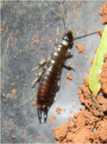
Fig. 22. Tijereta de la Familia Carcinophoridae.

Estos insectos son conocidos vulgarmente como “pica culos” y pueden ser confundidos con los escarabajos. Son insectos elongados y con boca masticadora. La mayoría de las especies presentan el primer par de alas como élitros y el segundo en forma de abanico. Se diferencian de otros insectos por la presencia, al final del cuerpo, de un par de estructuras a modo de forceps, cercos o pinzas. Realizan todo su ciclo de vida en el suelo, cavando y viviendo en túneles profundos en muchas ocasiones. Son principalmente de actividad nocturna y su función es detritívora y depredadora.