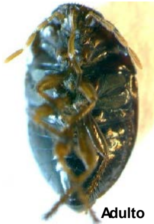
Fig. 25. Chinche de la Familia Cydnidae.

Todos los integrantes de Hemiptera, que habitan en el suelo, tienen hábito herbívoro pues atacan raíces u hojas. Se pueden encontrar en la hojarasca, dentro del suelo, debajo de la corteza de árboles caídos y en todo tipo de ecosistemas naturales o antropizados. Sus poblaciones son susceptibles a la aplicación de plaguicidas.