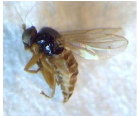
Fig. 24. Mosca de la Familia Phoridae.

La mayoría de las larvas de dípteros que habitan en el suelo son detritívoras, aunque algunas son depredadoras. Las especies detritívoras están asociadas con acumulaciones de materia orgánica y de excrementos, y su abundancia disminuye en suelos con bajo contenido orgánico.