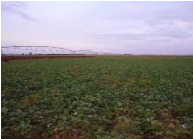
Fig. 38. Cultivo de Solanum tuberosum (papa).