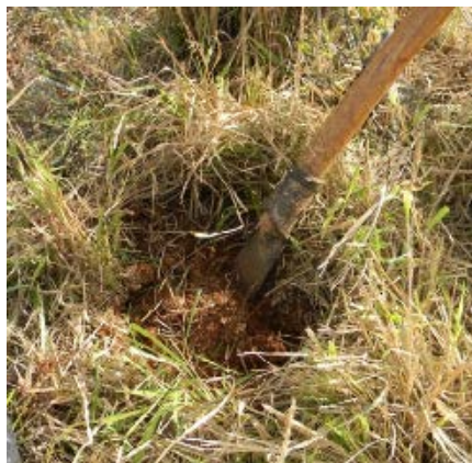
Fig. 42. Apertura del cuadrante de suelo con el empleo de una coa.