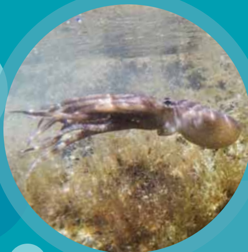
Diseño: sumarinno / Ilustración: Facu Soñia