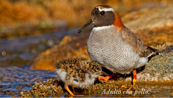
Adulto con pollo.