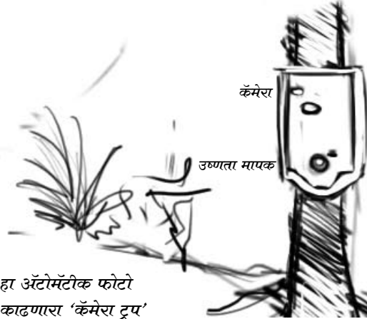
हा अ‍ॅटोमॅटिक फोटो काढणारा 'कॅमेरा ट्रप'

एके दिवशी घुले आणि मी रुंभोडीला काही कामानिमित्त गेलो होतो. तेथील लोकांना जेव्हा कळले की आम्ही बिबट्यांसंबंधी काम करायला आलो आहोत तेव्हा नेहमीप्रमाणे त्यांनी अनुभवलेली घटना सांगण्यास सुरुवात केली. त्यांच्या घराजवळ बाभळीचे एक सुंदर झाड होते. त्याची एक जाड फांदी त्यांच्या घराच्या छपरावर वळलेली होती. त्याच घरातील एका बाईनी सांगितले की सकाळी सहाच्या सुमाराच्या अंगण झाडत असताना त्यांच्या छोट्या मुलाने सांगितले की झाडावर एक मांजर आहे. ते मांजर म्हणजे एक बिबट्या होता. तो त्या आडव्या फांदीवर बसला होता. त्या बिबट्याने पाहिले की लोक आपल्याकडे पाहत आहेत तेव्हा तो झाडावरून उतरून पळून गेला. त्या बाई म्हणाल्या की त्यांच्या घराजवळ नेहमीच बिबट्यांचा वावर असतो.