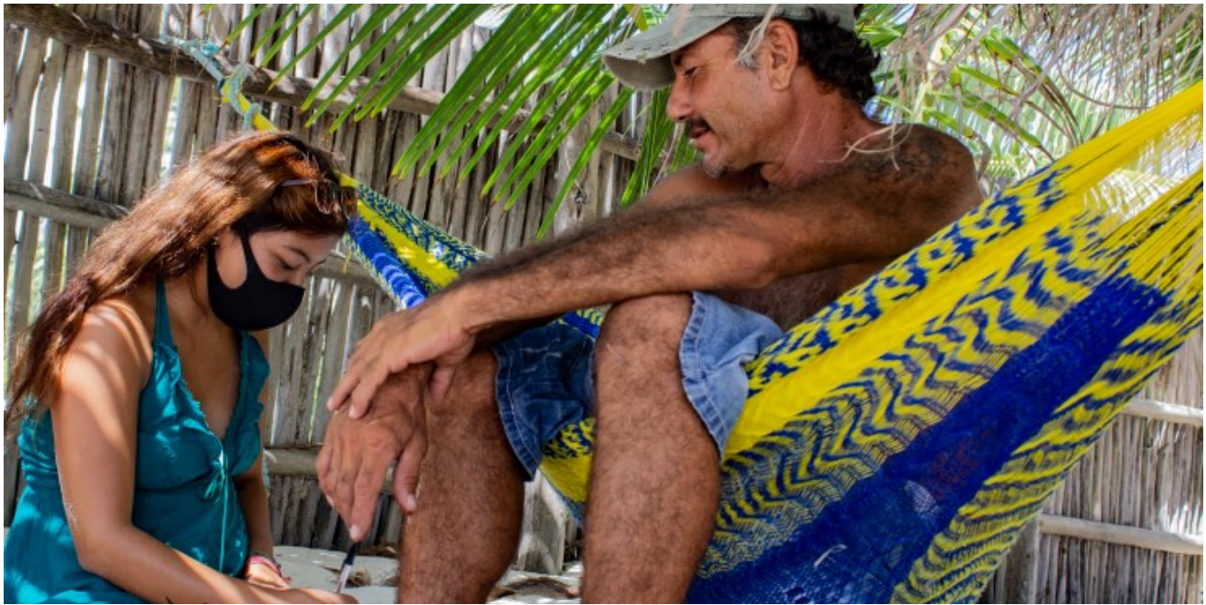
Entrevista a pescador en Isla Cozumel.