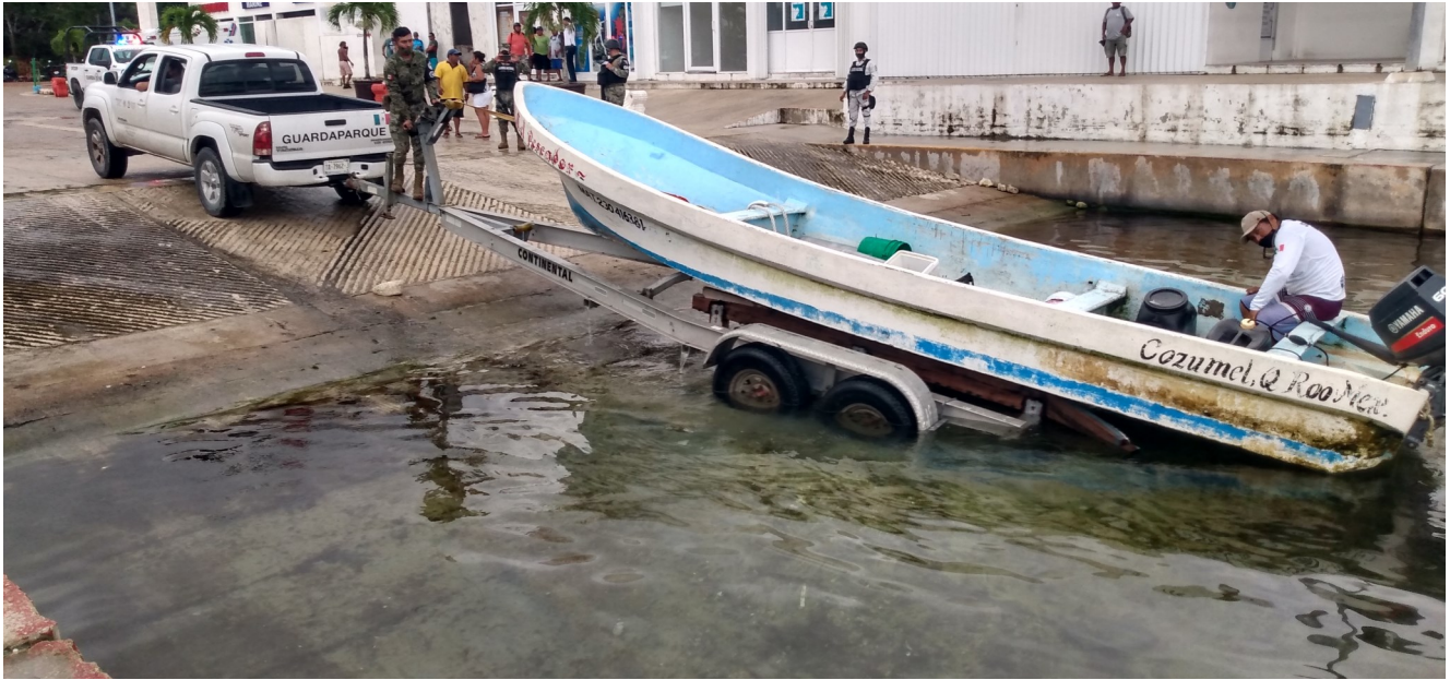
Embarcación asegurada.