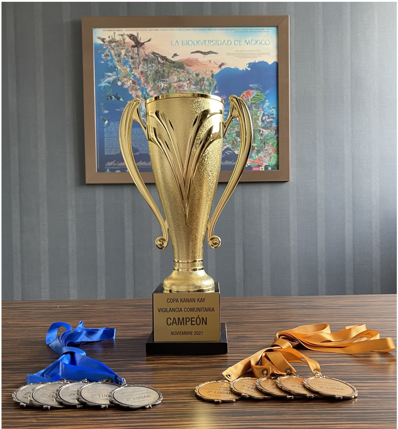
Copa Kanan Kay.

Las opiniones aquí expuestas son personales y no reflejan necesariamente las opiniones de FMCN, FCRH y/o la Alianza Kan Kay.