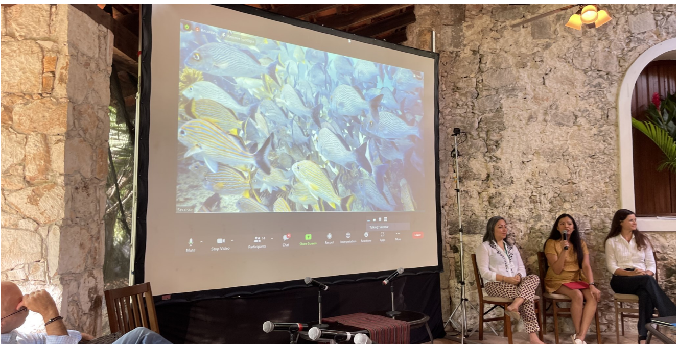
Participantes en el panel sobre ecosistemas marinos y costeros.

Las opiniones aquí expuestas son personales y no reflejan necesariamente las opiniones de FMCN, FCRH y/o la Alianza Kan Kay.