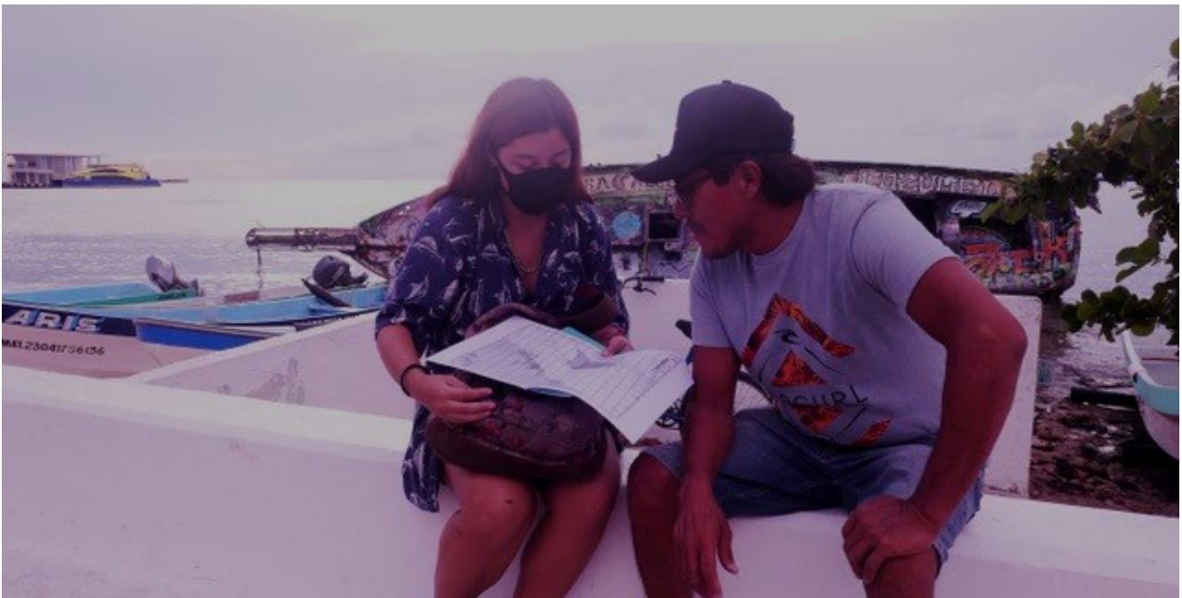
Revisión geoespacial de la pesca en Isla Cozumel.

Las opiniones aquí expuestas son personales y no reflejan necesariamente las opiniones de FMCN, FCRH y/o la Alianza Kan Kay.