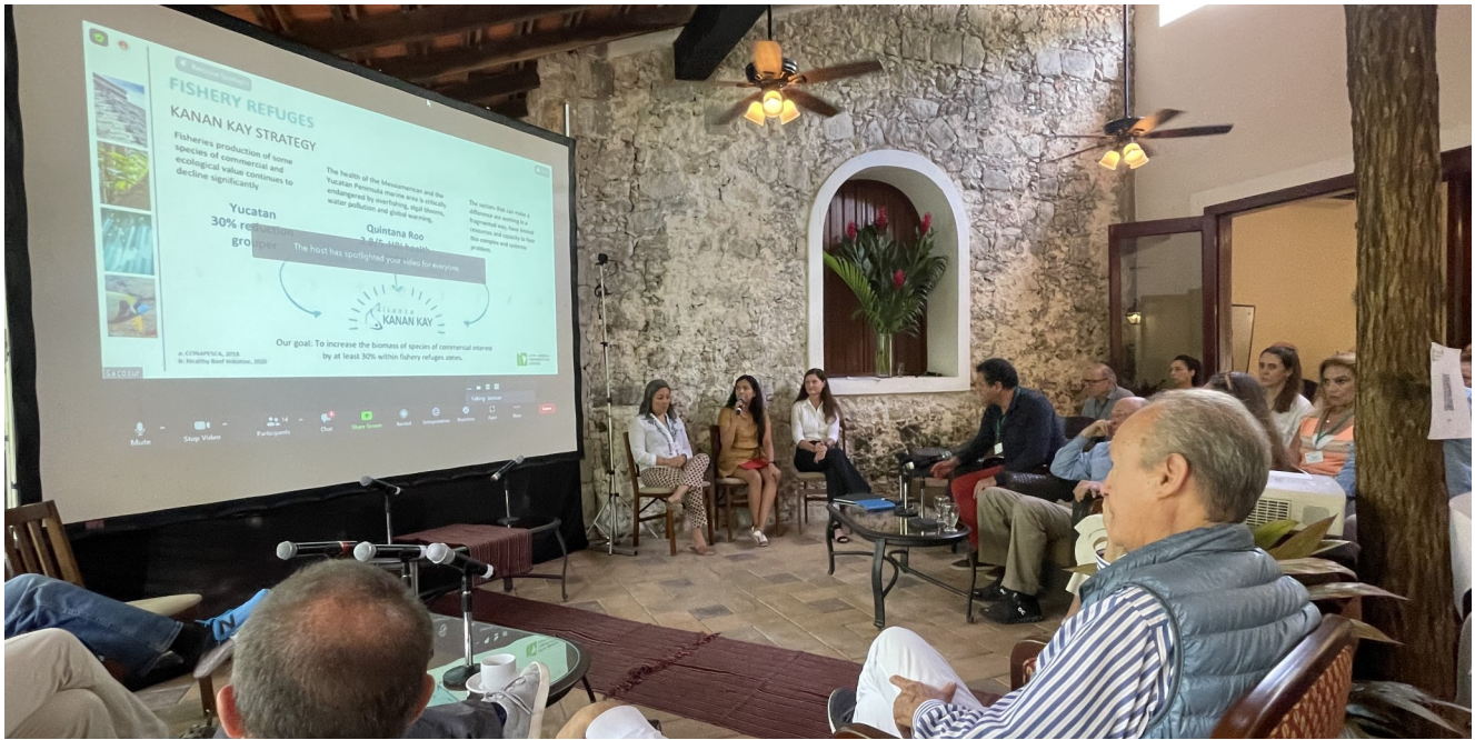
Presentación de la Alianza Kanan Kay en LACC.