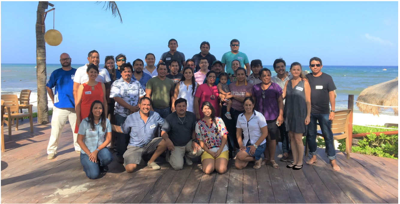
Primera Asamblea General de Minerva Rosette.