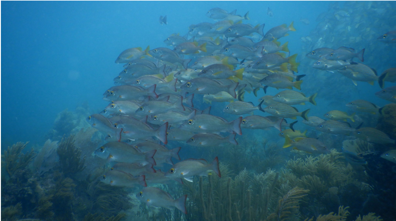
Esfuerzo colectivo.

Las opiniones aquí expuestas son personales y no reflejan necesariamente las opiniones de FMCN, FCRH y/o la Alianza Kan Kay.