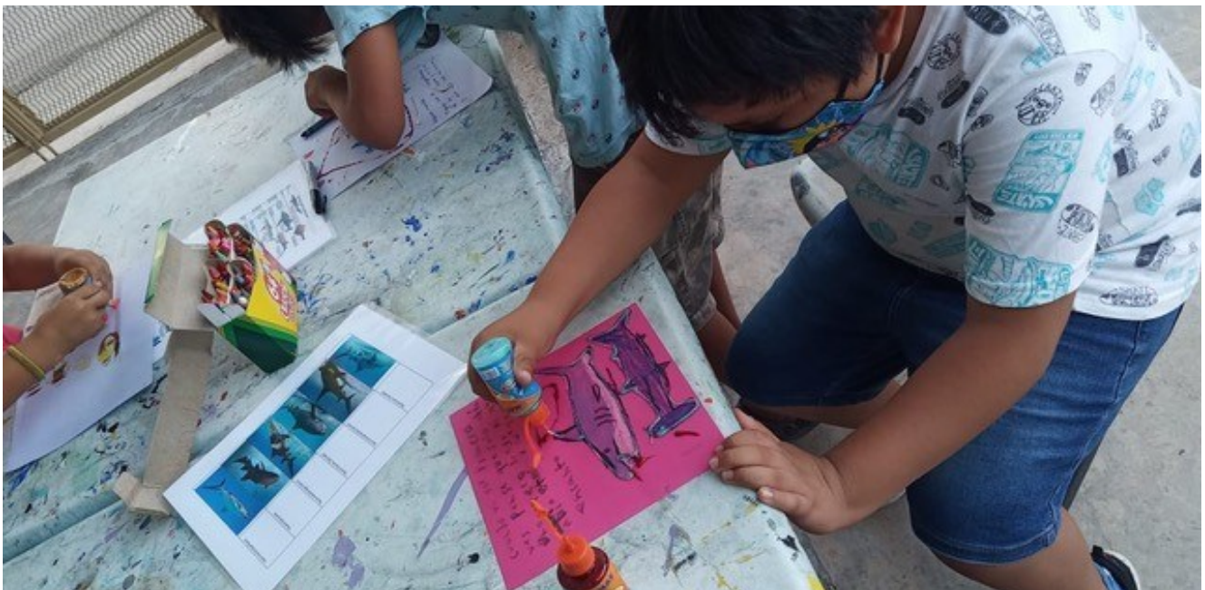
Participante en taller presencial.

Las opiniones aquí expuestas son personales y no reflejan necesariamente las opiniones de FMCN, FCRH y/o la Alianza Kan Kay.