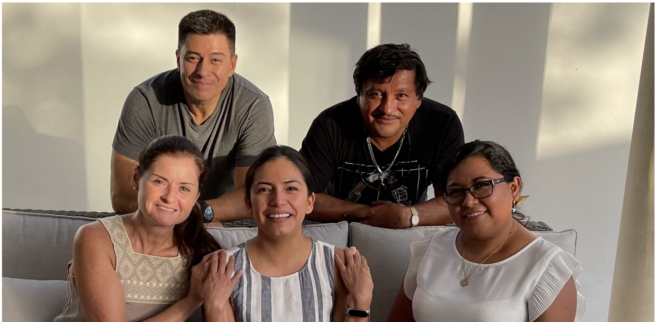
Reunión de Comité Coordinador de Alianza Kanan Kay.

Las opiniones aquí expuestas son personales y no reflejan necesariamente las opiniones de FMCN, FCRH y/o la Alianza Kan Kay.