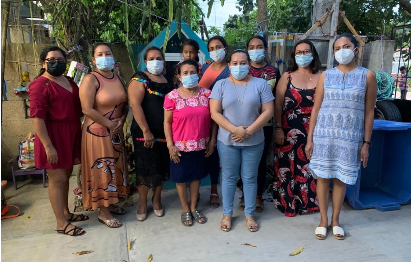
Participantes de la Cooperativa Turística Mujeres del Mar en el taller de cierre de autoestima y autocuidado.