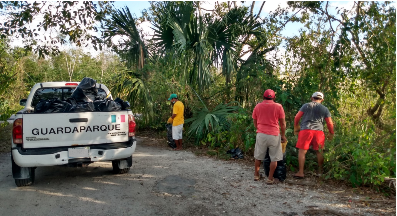
Ejecución de labores acordadas en acuerdo reparatorio.

Las opiniones aquí expuestas son personales y no reflejan necesariamente las opiniones de FMCN, FCRH y/o la Alianza Kan Kay.