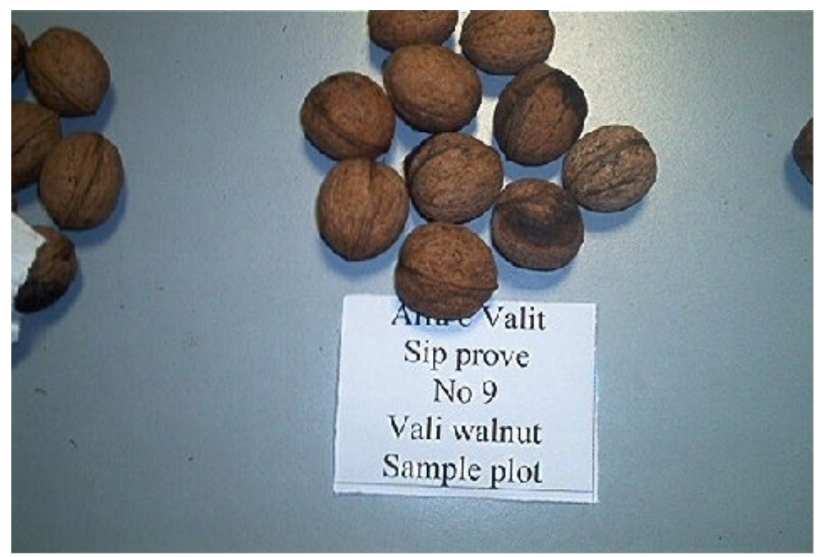
Figure 1. Representative fruits of sample plot No. 9

Very soon, a full report with additional photos and detailed information on all relevant expenditure in the period covered by the report will be sent to the Foundation.