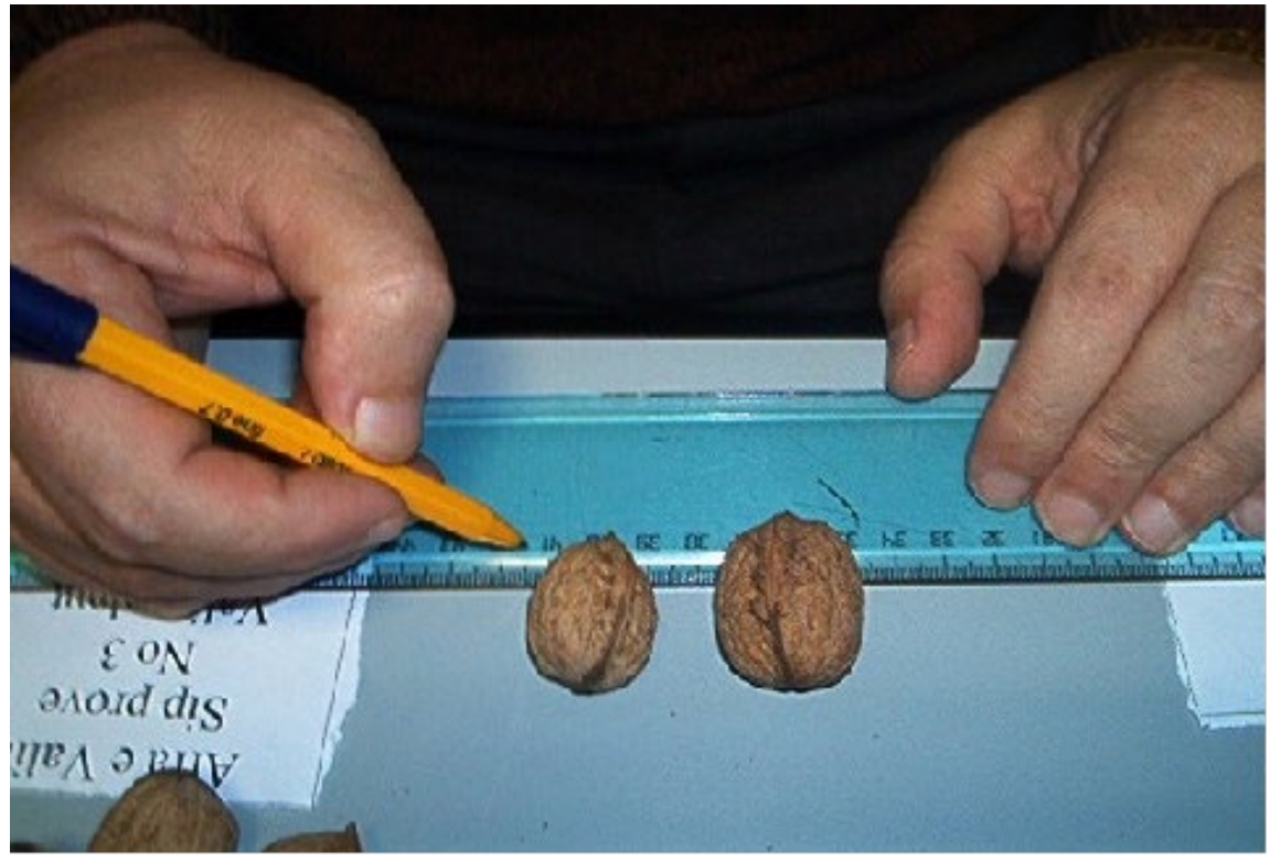
Figure 5. Measuring the fruit and kernel size of walnuts from different sample plots.