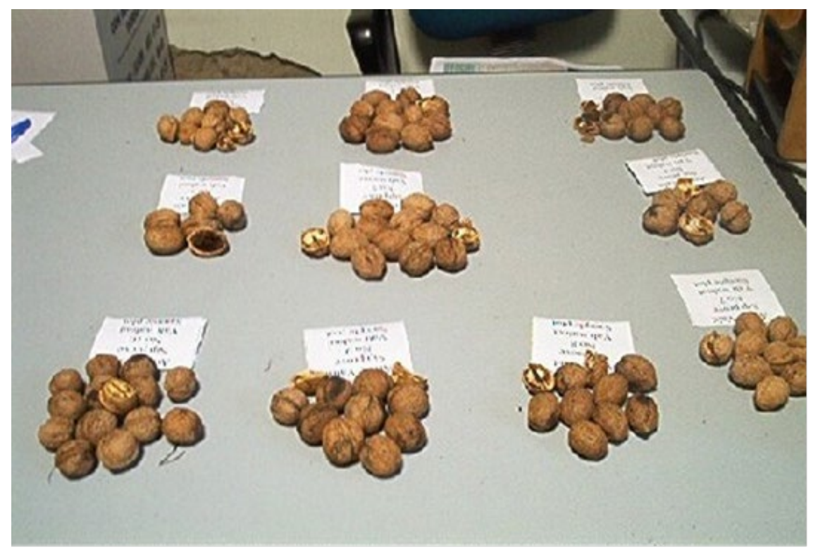
Figure 4. Representative walnut fruits from all 10 sample plots