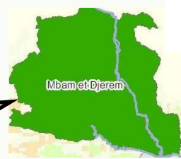
Localisation de la zone d'étude: le Parc National du Mbam et Djerem