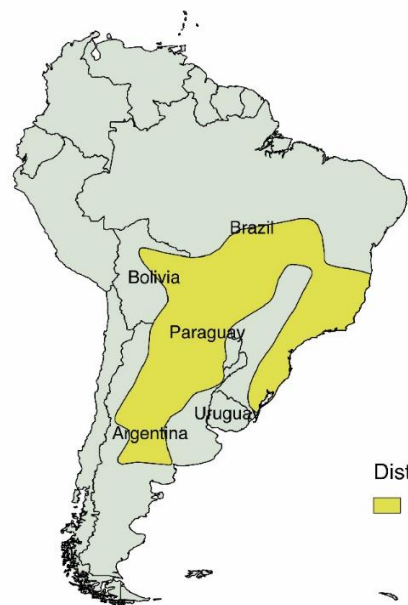
Distribución ■ Águila Coronada o del Chaco