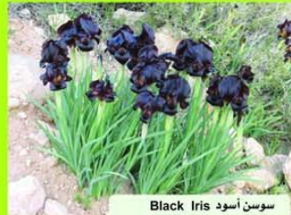
سوسن أسود Black Iris