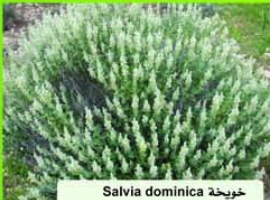
خويخة Salvia dominica