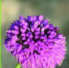
ثوم بري Allium - Garlic