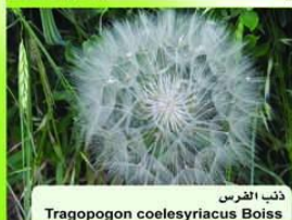
ذئب القرس Tragopogon coelestis Boiss