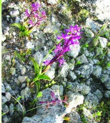
أوركيد الأناضول (سحلب) Orchis Anatolica