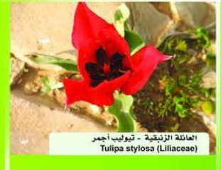
العائلة الزنبقية - توليب أجمر Tulipa stylosa (Liliaceae)