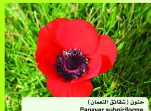
حنون شقائق النعمان Papaver subpiriforme