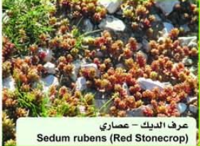
عرف الديك - عصاري Sedum rubens (Red Stonecrop)