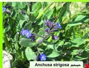
حمحم Anchusa strigosa