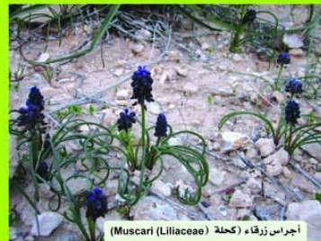
أجراس زرقاء كحللة (Muscari (Liliaceae))