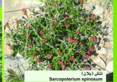
تشنج (بلان) Sarcopoterium spinosum