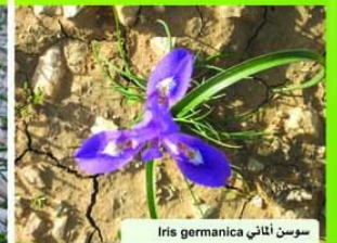
سوسن الماني Iris germanica