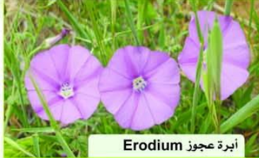
أبرة عجوز Erodium