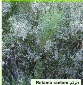
الرتم Retama raetam