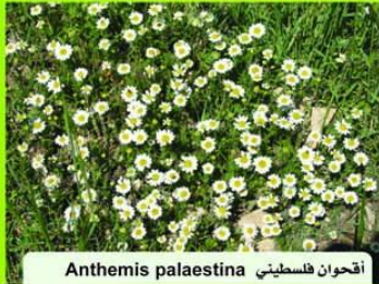
أقحوان فلسطيني Anthemis palestina