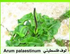
لوف فلسطيني Arum palaestinum