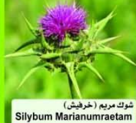
شوك مريم (خرفيش) Silybum marianum