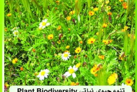
تنوع حيوي نباتي Plant Biodiversity