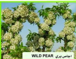
اجاص بري WILD PEAR