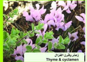
زعتروقرن القزالي Thyme & cyclamen