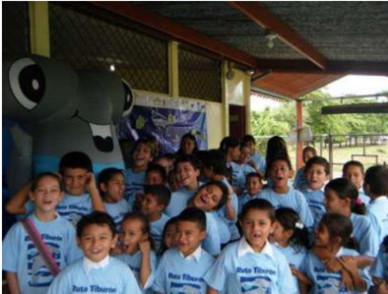
Annex XX. Students watching a video on shark ecology. Sandalo, Puntarenas.