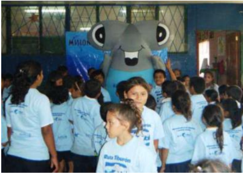
Annex XIX. Students watching a video on shark ecology, Playas del Coco, Guanacaste.