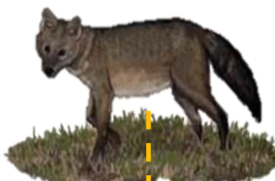
Graxaim do mato