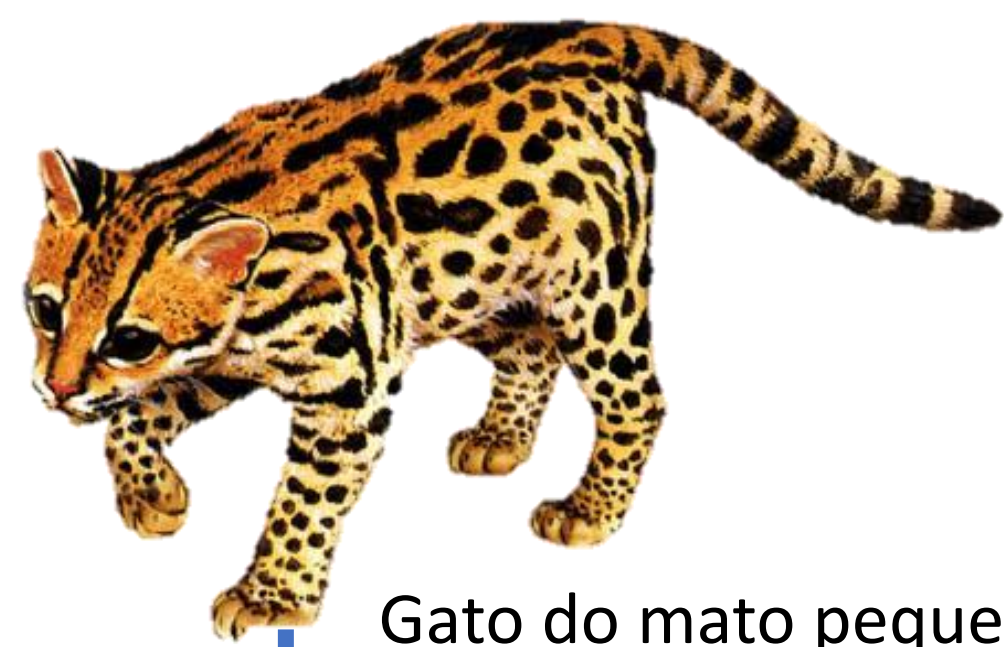
Gato do mato pequeno

Um mesopredador é um animal de porte médio que está no meio da cadeia alimentar. Eles possuem papel importante no equilíbrio dos ecossistemas: suas populações regulam tanto populações de superpredadores (como grandes felinos), que os predam, quanto de suas presas, que são geralmente herbívoros tidos como pragas agrícolas.