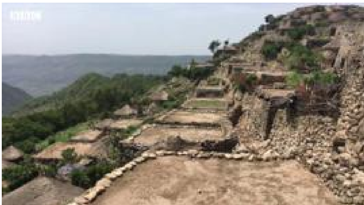
O vilarejo que sobrevive há mais de 900 anos no topo de uma montanha