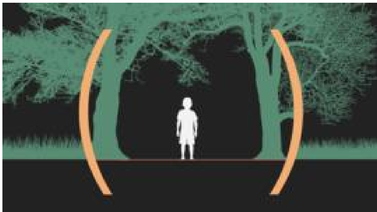
Desnutrição, abusos e mortes fazem da Amazônia o pior lugar do Brasil para ser criança