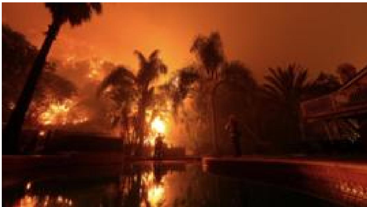
Os bombeiros particulares que protegem casas de ricos e famosos dos incêndios na Califórnia