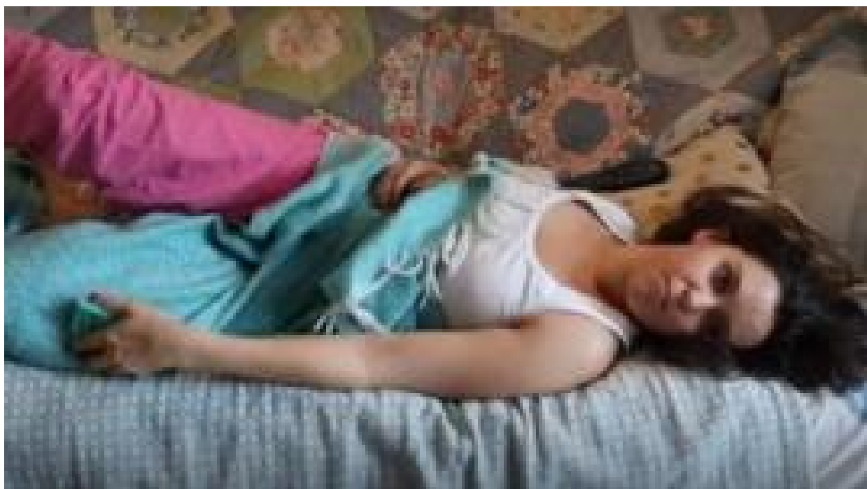
Quando ser preguiçoso pode ser bom para a saúde, segundo a ciência