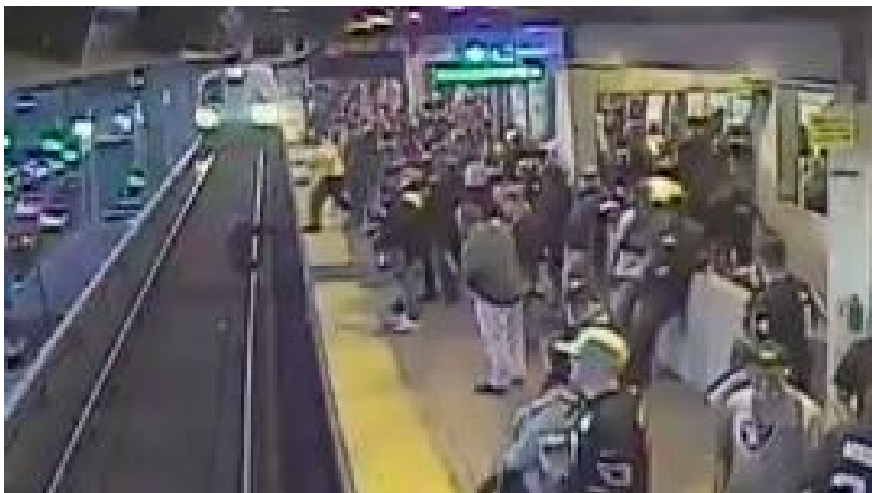
Homem escapa de atropelamento por um triz depois de cair em linha do metrô nos EUA