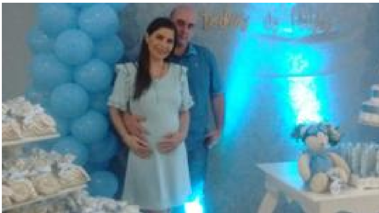
'Emagreci 20 quilos durante a gravidez e os médicos não entendiam por quê'