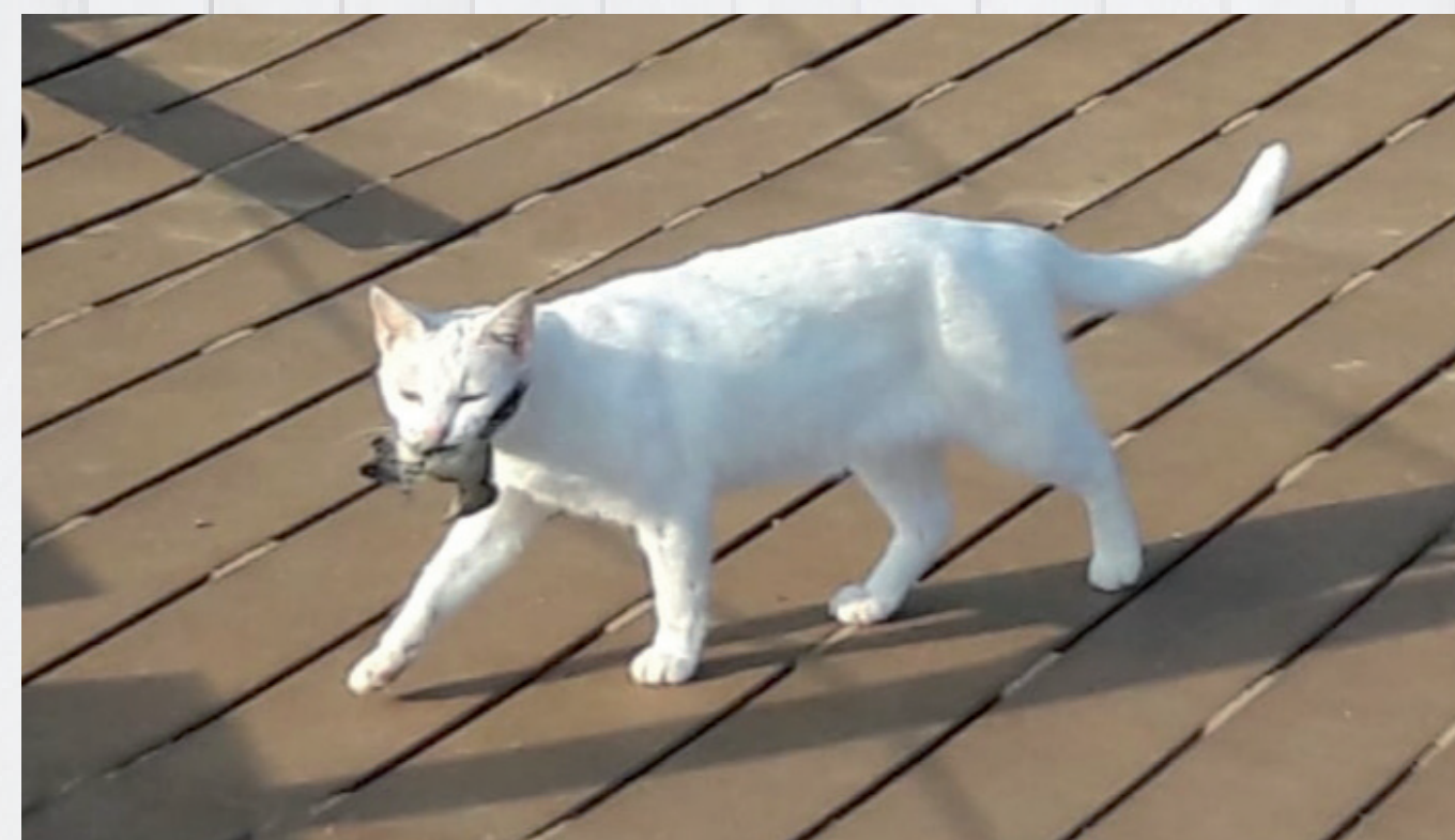
Gato preda um pássaro endêmico de Noronha da espécie Elaenia ridleyana , na Praia do Sueste, no Parque Nacional Marinho de Fernando de Noronha