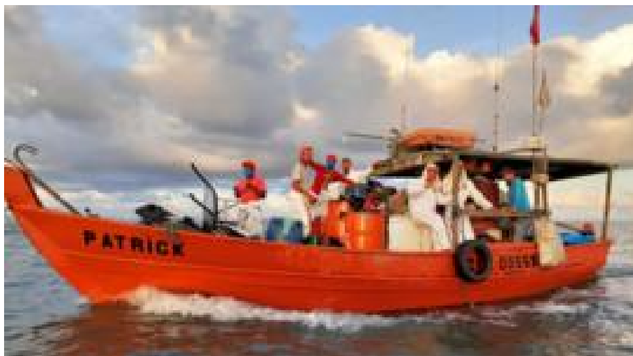
Puçá ou siripoia? O manual que ensina a 'pescar óleo' no Nordeste unindo ciência e lições de pescadores