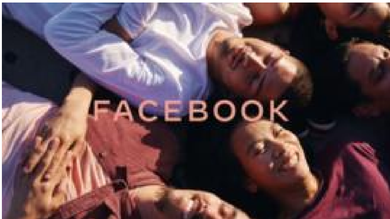
Qual a diferença entre Facebook e FACEBOOK - e por que a empresa usará as 2 marcas