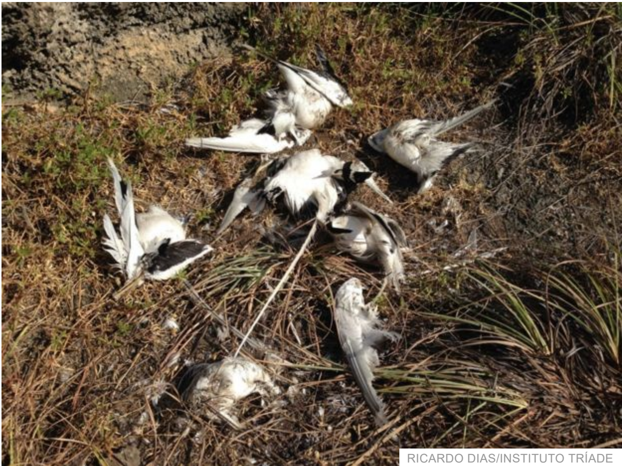
RICARDO DIAS/INSTITUTO TRIÁDE

Mas a espécie invasora que mais preocupa é mesmo o gato. Segundo a pesquisadora Tainah Guimarães, do Centro Nacional de Avaliação da Biodiversidade e de Pesquisa e Conservação do Cerrado (CBC), também do ICMBio, há três tipos deles no arquipélago: domésticos ou domiciliados (aqueles que têm dono e casa); animais errantes ou peridomiciliados (que não possuem donos e vivem nas vilas perto de pousadas e restaurantes, e são alimentados por todos); e os ferais ou asselvajados (sem donos e que vivem na mata, sem interação com humanos).