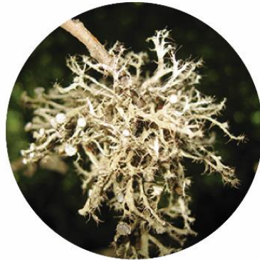
ԱՆԱՊՏԻՆԻԱ ԽՈՉԱՆԱԿԱԿԻՐ ANAPTYCHIA SETIFERA

ԱՅՍ ՏԵՍԱԿԸ ԱՃՈՒՄ Է ԳԻՆԱԿԱՆՈՒՄ ԾՅՈՐԵՐԻ ՎՐԱ ՀԱՅԱՍՏԱՆԻ ԲԱՐԵՒԱՆՆ ԼԱՅՆԱՏԵՐԵՎ ԱՆՏԱՆՈՒՍԵ ԵՎ ՆՈՒՄԱՆՏԱՌԱՅԻՆ ԿԱՐԵՎՈՐ ԲՈՒՍԱԲԱՆԱԿԱՆ ՏԱՐԱԾՔՆԵՐՈՒՄ: ԱՅՆ ՏԱՐԵԿՎՈՒՄ Է ՇԱՏ ՆՄԱՆ ԱՆԱՊՏԻՆԻԱ ԹԱՐԹՈՉԿՎՈՐ ՏԵՍԱԿԻՑ ՓՇԱԿՈՐ ԱՊՈԹԵՑԻՈՒՄԻ ԵԶՐՈՎ: