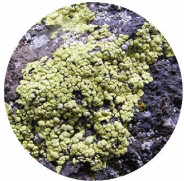
ՌԻԶՈԿԱՐՊՈՆ ԱՃԽԱՐՀԱԳՐԱԿԱՆ RHIZOCARPON GEOGRAPHICUM

ԱՅՍ ՏԵՍԱԿԸ ՏԱՐԱԾԿԱԾ Է ՀԱՅԱՍՏԱՆԻ ՈՐՈՇ ԿԱՐԵՎՈՐ ԲՈՒՍԱԲԱՆԱԿԱՆ ՏԱՐԱԾՔՆԵՐՈՒՄ, ԾԱՌԵՐԻ ԵՎ ԱՅԼ ՍՈՒՍՏՐԱՍՏԵՐԻ ՎՐԱ: ԱՅՆ ՀԵՏՆՈՒԹՅԱՄԲ ԿԱՐՈՂ ԵՔ ՃԱՆԱՉԸ, ԻՐ ԿԱՌ ԿԱՆԱՉ ԳՈՐԱԿՈՐՄԱՆ ԵՆՈՐԳԻՎ: