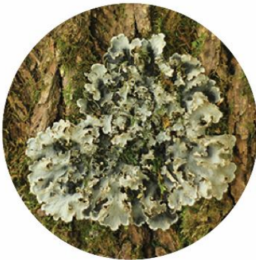
ՊԵԼՏԻԳԵՐԱ ԵՐԻՉԱԿՈՐ PELTIGERA PRAETEXTATA

ԱՅՍ ՏԵՍԱԿԸ ՏԱՐԱԾԿԱԾ Է ՀԱՅԱՍՏԱՆԻ ԳՐԵԹԵ ԲՈՒՐՈՐ ԿԱՐԵՎՈՐ ԲՈՒՍԱԲԱՆԱԿԱՆ ՏԱՐԱԾՔՆԵՐՈՒՄ, ԾԱՌԵՐԻ ԲՆԵՐԻ ՀԻՆՆԱՅԻՆ ՀԱՑԿԱՑՆԵՐՈՒՄ: ԱՅՍ ՏԵՍԱԿԸ ՀՆԱՐԱԿՎՈՐ Է ՏԱՐԵԿՐԸ, ԱՏՈՐԻՆ ՄԱԿԵՐԵՍԻ ՆԿԱՏԵԼԻ ԲԱՐՁՐԱՑԿԱՑ ԶՐԱՎՈՐՄԱՄԲ, ՈՐԸ ԳՈՐԱՑ Է ԾԱՅՐՈՒՄ ԵՎ ՄՂԱՆՈՒՄ Է ԿԵՆՏՐՈՆԱԿԱՆ ՄԱՍՈՒՄ, ԻՉԶՊԵՍ ՆԱԵՎ ԹԵՓՈԿԱՆՄԱՆ ԳՈՑՁԱՑՈՒԹՅՈՒՆՆԵՐՈՎ ԻՉԻԳԻՈՒՆՆԵՐՈՎ (ԵՉԻԳԻՈՒՆՆԵՐՈՎ):