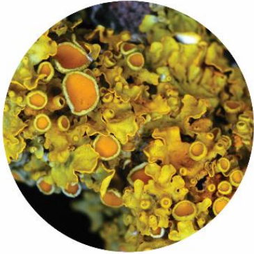
ՔՍԱՆԹՈՐԻԱ ՊԱՏԻ XANTHORIA PARIETINA

ԱՅՍ ՏԵՍԱԿԸ ԼԱՅՆՈՐԵՆ ՏԱՐԱԾԿԱԾ Է ՀԱՅԱՍՏԱՆԻ ԿԱՐԵՎՈՐ ԲՈՒՍԱԲԱՆԱԿԱՆ ՏԱՐԱԾՔՆԵՐՈՒՄ: ԱՅՆ ՀԱՐԱԿՎՈՐ Է ՏՈՐԲԵՆԸ ԱՅԼ ՆՄԱՆ ՏԵՍԱԿԵՐԻՑ, ԿՆՃՈՒՑ, ԿԱՐԴԱԶՈՐԴԱՆՄԱՆ ԹԱԼՈՒՄԿ, ՍՈՐԵԴԻՈՒՆՆԵՐԻ ԲԱՑԱԿԱՑՈՒԹՅԱՄԲ ԵՎ ԱՊՈԹԵՑԻՈՒՆՆԵՐԻ ԱՊԿԱՑՈՒԹՅԱՄԲ: