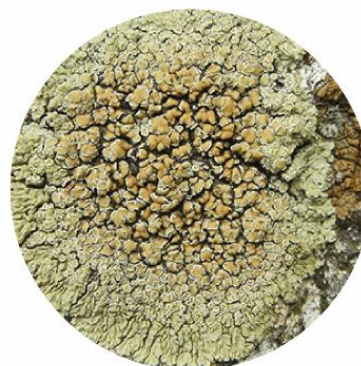
ԼԵԿԱՆՈՐԱ ՊԱՏԻ LECANORA MURALIS

ԱՅՍ ՏԵՍԱԿԸ ՏԱՐԱԾԿԱԾ Է ՀԱՅԱՍՏԱՆԻ ԳՐԵԹԵ ԲՈՒՐՈՐ ԿԱՐԵՎՈՐ ԲՈՒՍԱԲԱՆԱԿԱՆ ՏԱՐԱԾՔՆԵՐՈՒՄ, ՏԱՐԵՐԻ ՍՈՒՍՏՐԱՍՏԵՐԻ ՎՐԱ: ԹԱԼՈՒՄԸ ԿԱՆԱՉԱԿՈՒՄ Է, ԱՃՈՒՄ Է ՃՈՒԿԱՑԱԶԱԶԵՎՎՎ ԿԱՐԴԱԶՈՐԴԱՆՄԱՆ, ԻՆԿ ԿԵՆՏՐՈՆԱԿԱՆ ՄԱՍՈՒՄ ԳՏՆՎՈՒՄ ԵՆ ԴԵՐԻՆ ՄԿԱՎԱՌԱՍԱԶԱՆ ԱՊՈԹԵՑԻՈՒՆՆԵՐԸ: