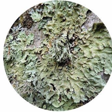
ՖԼԱՎՈՊԱՐՄԵԼԻԱ ԱՅՈՒ FLAVOPARMELIA CAPERATA

ԱՅՍ ՏԵՍԱԿԸ ՀԱՆԴԻՊՈՒՄ Է ՏԱՎՈՒՅԻ, ԼՈՐԻ, ՎԱՅՈՑ ԶՈՐԻ ԵՎ ՍՅՈՒՆԻՔԻ ՄԱՐԶԵՐԻ ԿԲՏ-ՆԵՐՈՒՄ ԲԱՐԵՒԱՆՆ ԼԱՅՆԱՏԵՐԵՎ ԱՆՏԱՆՆԵՐՈՒՄ, ԾԱՌԵՐԻ ԲՆԵՐԻ ԿԵՂԵՎԻ ՎՐԱ: ԱՅՆ ՈՒՆԻ ԴԵՂՆԱԿՈՒՄ ԿԱՆԱՉ ՄԵՑ ԹԱԼՈՒՄ: