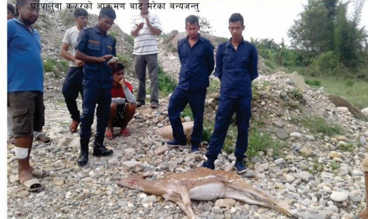
घरपालुवा कुकुरको आक्रमण बाट मरेका वन्यजन्तु