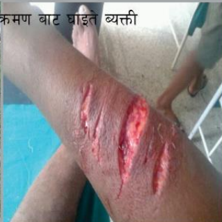
मगर गाही र जसका आक्रमण बाट घाइते ब्यक्ती