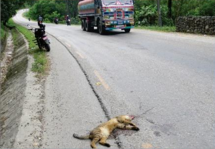
गाडी बिस्तारै चलाऊनुहोस बन्धजन्तुहरु बाटो काट्दै छन