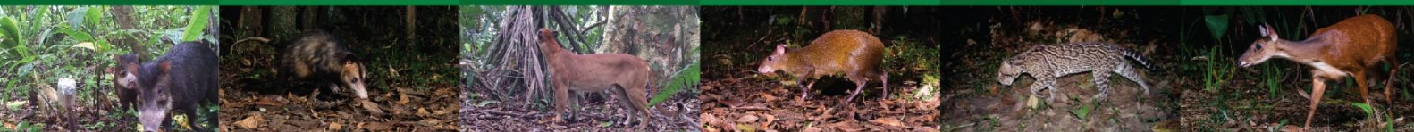
Cabro de montaña/Red bracket deer ( Mazama americana )