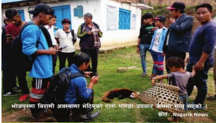
भोजपुरमा विद्यालयी अक्सामा भेटिएको रातो पाण्डा उपचार केन्द्रमा लगेर आएको ।