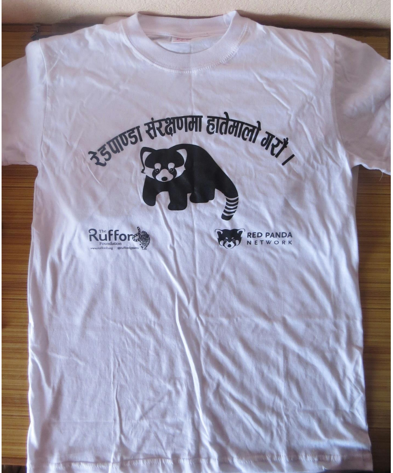
T-shirt with conservation message