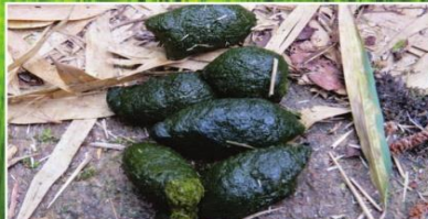
रातो पाण्डाको खाना