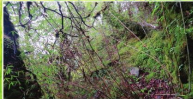
रातो पाण्डाको वासस्थान