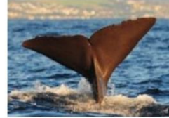
Cachalote (Sperm Whale) (Physeter macrocephalus)