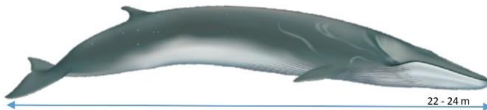
Ballena de aleta o Rorcual común (Fin Whale) ( Balaenoptera physalus )