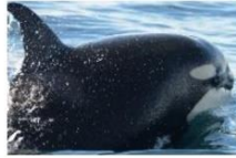
Orca (Killer Whale) (Orcinus orca)