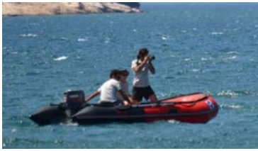
Foto-Kimliklendirme: Bu uygulama için uygun hava koşullarında yunus gözlemleri yaparak bireylerin tanımlanacağı fotoğraflar çekmek.